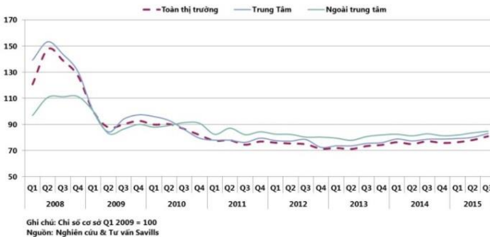
Biểu đồ 2 – Chỉ số văn phòng theo quý

Trong Q3/2015, tổng lượng tiêu thụ văn phòng đạt hơn 63.000m 2 , tăng 148% theo quý và 112% theo năm, chủ yếu từ các tòa nhà hạng A và B. Dự kiến sẽ có thêm 11 dự án mới gia nhập thị trường, đến cuối năm 2016 tổng nguồn cung văn phòng dự kiến sẽ đạt 1,6triệu m 2 , tăng 7% so với năm 2015.