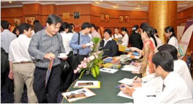
Propex Vietnam 2009 được giới thiệu rộng rãi tại các sự kiện do HoREA tổ chức.

Truyền thông, quảng bá là một phần thiết yếu trong tất cả sự kiện diễn ra trong và ngoài nước. Vì vậy, Ban tổ chức Triển lãm và Hội nghị Bất động sản Việt Nam 2009 (Propex Vietnam 2009) rất coi trọng công tác này ngay từ những ngày đầu. Cho đến nay, sau hơn 4 tháng ra mắt triển lãm, với 2 lần chính thức giới thiệu triển lãm và các hoạt động chủ yếu trước các sở-ban-ngành, các công ty tiềm năng và các phương tiện truyền thông báo đài, Ban tổ chức đã đang và sẽ không ngừng đầu tư xây dựng một chiến lược quảng bá trong và ngoài nước cho sự kiện này để Propex Vietnam 2009 thật sự là một sân chơi đẳng cấp quốc tế trong ngành BĐS tại Việt Nam.