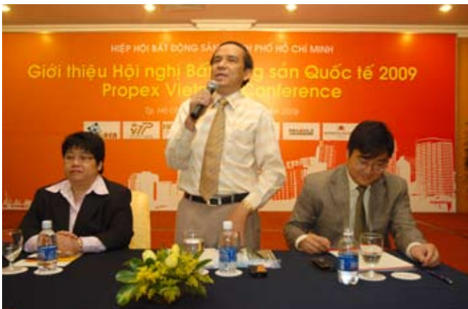
Ban tổ chức đang giới thiệu về Hội nghị Bất động sản Quốc tế 2009.

Sáng ngày 4/8/2009, tại khách sạn Windsor Plaza, Hiệp hội Bất động sản TP.HCM (HoREA) và Công ty Cổ phần Kiến trúc Xây dựng Nhà Vui đã giới thiệu Hội nghị Bất động sản Quốc tế 2009 (Propex Conference) với chủ đề chính Giải pháp phát triển bền vững thị trường bất động sản Việt Nam . Hội nghị sẽ được diễn ra từ chiều ngày 17/12/2009 đến hết ngày 18/12/2009 tại Phòng hội thảo lớn, lầu 1, SECC.