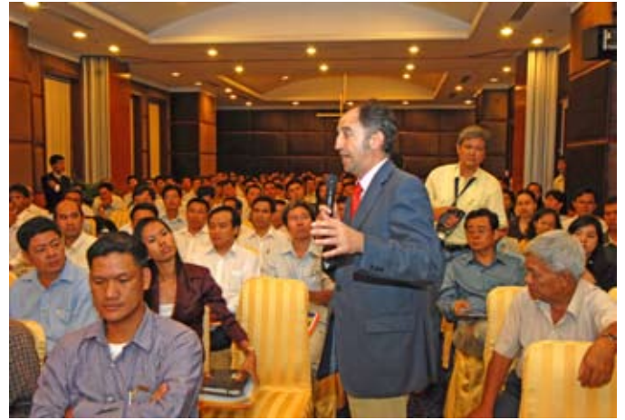
Propex Vietnam 2009 nhận được sự quan tâm đặc biệt của bạn bè quốc tế.