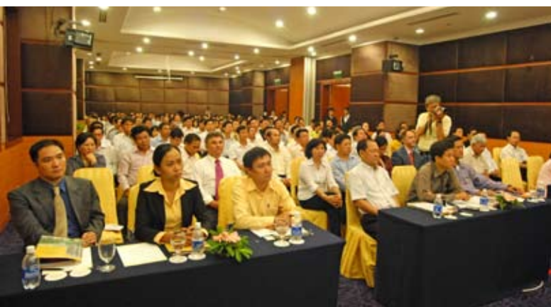
Lễ ra mắt có sự tham dự của 250 hội viên HoREA và gần 40 phóng viên báo đài.