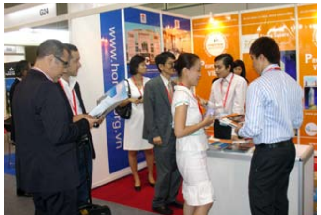
Quảng bá Propex Vietnam 2009 tại Triển lãm và Hội nghị Cityscape Asia 2009, Singapore.