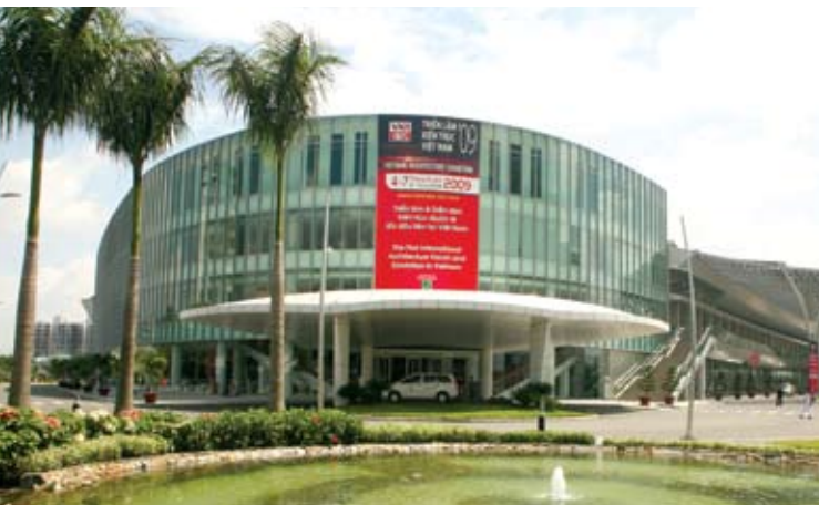
Trung tâm Hội chợ & Triển lãm Sài Gòn (SECC).

Propex Vietnam sẽ được tổ chức định kỳ vào tháng 12 hàng năm, bắt đầu là Propex Vietnam 2009.